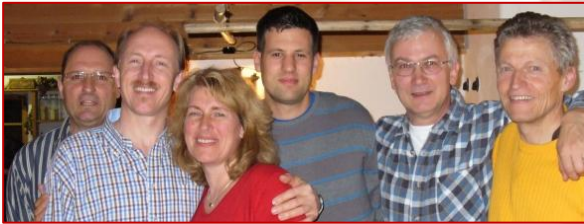
Vereinsmitglieder Perspektive Senegal

Liebe Freunde , am 25. Mai wird der Internationale Tag der vermissten Kinder begangen. Viele Kinder unseres Zentrums teilten dieses Schicksal. Sie sind aus ihren Dörfern, z.T. vom Nachbarland nach Senegal verschleppt und zum Betteln gezwungen worden.