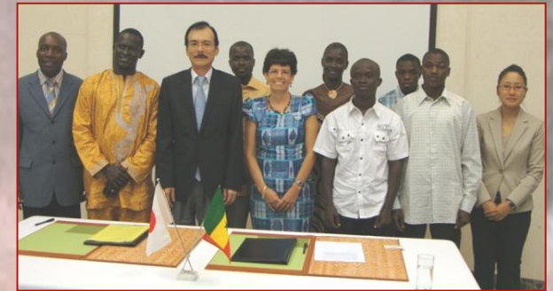
Das Team von Perspektive Senegal mit ehemaligen Straßenkindern in der japanischen Botschaft zur Unterzeichnung der 60 000 € Förderung.

Bei uns hat er wieder ein Zuhause gefunden. Er lernt fleißig in der Schule und macht mit Freude die Schusterausbildung. Er möchte nie mehr betteln.