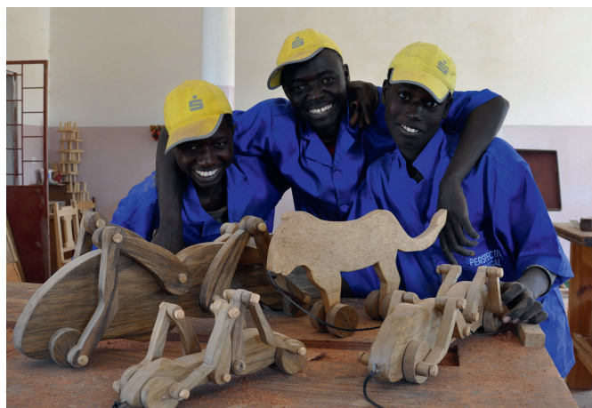
selbstgebautes Holzspielzeug der Schreinerlehrlinge